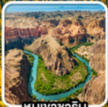
หุบเขาซาริน