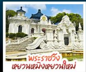
พระราชวังเซวานเม็งเซวานนิเม