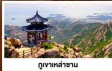
ภูเขาเหล่านาน