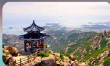
ภูเขาเหลาชาน