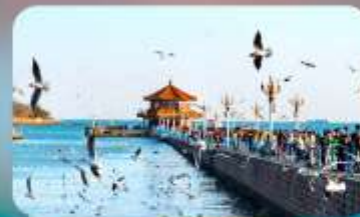
สะพานจันเฉียว