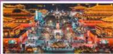
ถนนวัฒนธรรมราชวงศ์ถัง