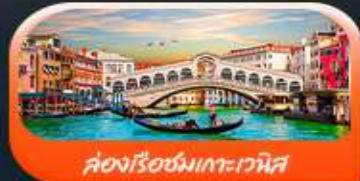
คลองเรือชมเกาะเวนิส