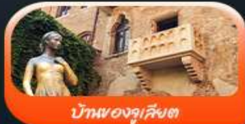
บ้านของจูเลียต