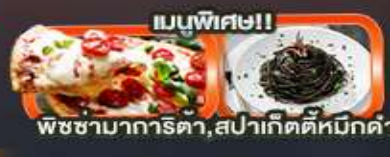
เมนูพิเศษ!! พิชชามากาเร็ตต้า, สปาเก็ตตี้หมักดำ