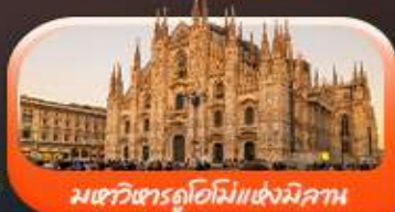
มหาวิหารดูโอโมแห่งมิลาโน