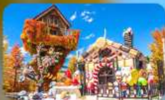
โรงงานช็อกโกแลต ชิโรอิ โคอิบิโตะ