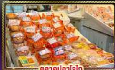
ตลาดปลาโอไก