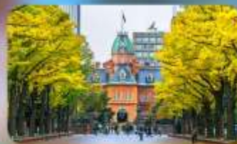
อัสระ:ตามอัสระสาย 1 วัน