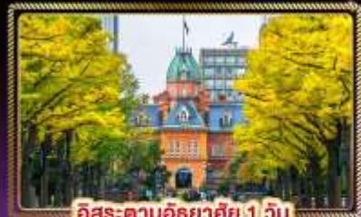
ฮิโรสะ-ตามฮิโรซากิ 1 วัน

🧳น้ำหนักกระเป๋า 20 Kg. บริการอาหาร บนเครื่องบิน