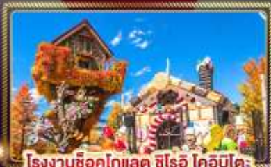
โรงงานช็อคโกแลต ชิโรอิ โคอิบิโคะ