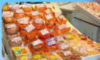
ตลาดปลาโจโก