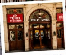
สถานีทูเนล (TUNEL STATION) สถานีรถไฟใต้ดินสายเก่าแก่ และเป็นหนึ่งในระบบขนส่งที่เก่าแก่ที่สุดในโลก