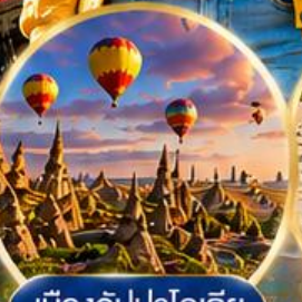
เมืองคปปาโดเกีย Cappadocia