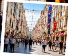
ISTIKLAL STREET (Grand Avenue of Pera) ถนนสายช้อปปิ้ง อิม บิล ครบจบในที่เดียว