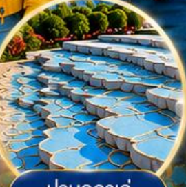
ปานุกคาล่ Pamukkale