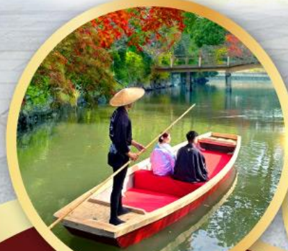
กิจกรรมล่องเรือยามากาวะ