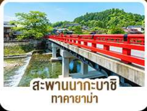
สะพานนากะบาชิ ทาคายาม่า