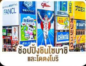
ช้อปปิ้งชินโซบาชิ และโดตงโมริ