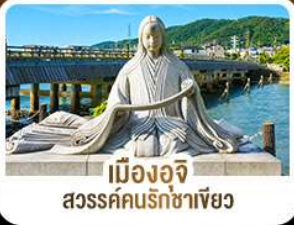
เมืองอจิว สวรรค์คนรักชาเขียว

คามิโดจิ สวรรค์บนดินแห่งเทือกเขาแอลป์ ชมสะพานคัปปาบาชิ ชมวัดเบียวโดอิน • เมืองทาคายาม่า • ตลาดปลาชิชิ • ช้อปปิ้งชินโซบาชิ • อีออนมอลล์