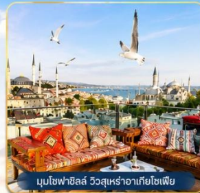
มุขโหลวฮิลล์ วิวสุเหร่าฮาเจียโซเฟีย

ช่องแคบบอสฟอรัส • สุเหร่าสีน้ำเงิน • สุเหร่าฮาเจียโซเฟีย