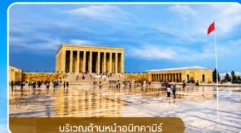
บริเวณด้านหน้าอนีกาบิร์