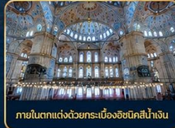
ภายในตกแต่งด้วยกระเบื้องอิสตันบูลสีน้ำเงิน