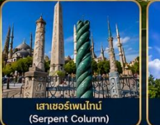
เสาฮอร์เพนไทน์ (Serpent Column)