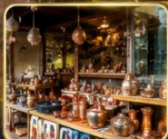
เลือกซื้อของฝากงานหัตถกรรมพื้นเมือง