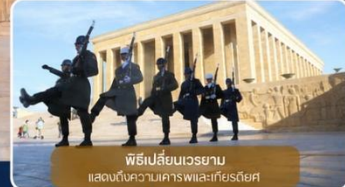
พิธีเปลี่ยนเวรยาม แสดงให้เห็นเคารพและเกียรติยศ