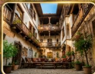
บ้านเรือนสไตล์ออตโตมัน อายุกว่า 200 ปี

เมืองท่องเที่ยวที่มีชื่อเสียงของจังหวัดการาบิก (Karabük) ในปี 1994 เมืองซาฟรานโบลู ได้ถูกองค์การยูเนสโกยกให้เป็นมรดกโลกทางด้านวัฒนธรรม