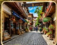
เดินเล่นย่านเมืองเก่าบรรยากาศย้อนยุค