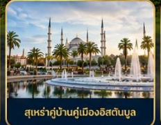
สุเหร่าบ้านคูเมืองอิสตันบูล