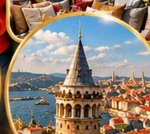
หอคอยกาลาตา Galata Tower