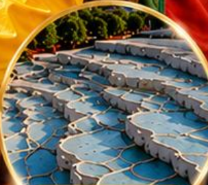
ปามุกคาล่า Pamukkale