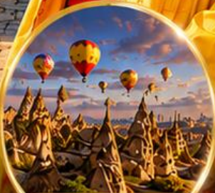
เมืองคัปปาโดเกีย Cappadocia