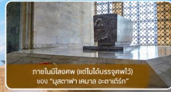
ภายในมีสิ่งศพ (แต่ไม่ได้รับอนุญาต) ของ "มุสตาฟา เคมาล อตาเติร์ก"