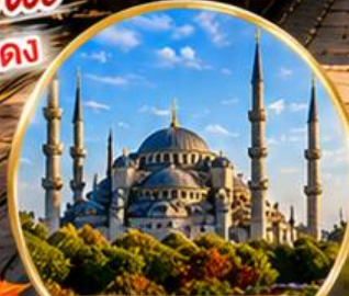
สุเหร่าสีน้ำเงิน Blue Mosque