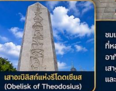
เสาอเบลิสก์แห่งโรโดเดียม (Obelisk of Theodosius)