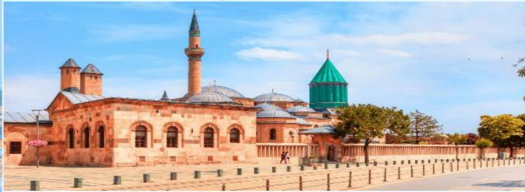
พิพิธภัณฑ์เมฟลานา