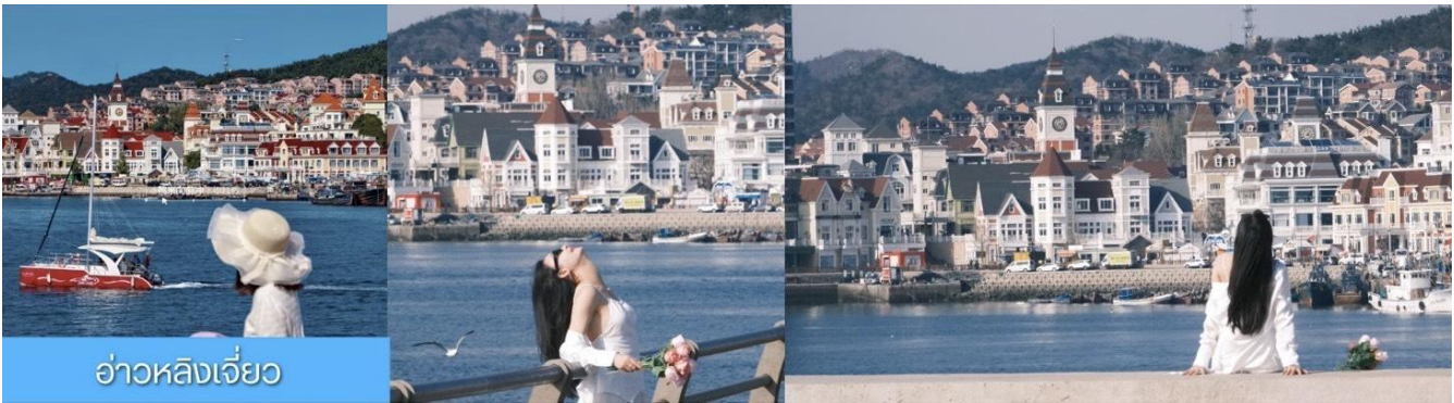
อ่าวหลังเจียว