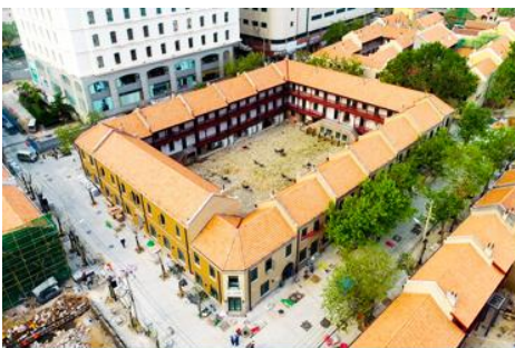
เมืองเก่าเยอรมัน ตรอกกว่างซิงหลี่