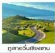
ภูเขาวันเชียงซาน