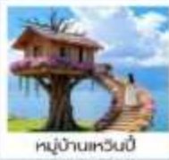
หมู่บ้านเหวินปี้