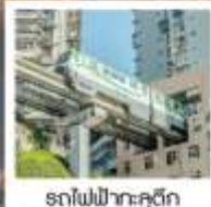
รถไฟฟ้าคะคุติ๊ก