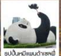
รูปปั้นหมีแพนด้าเซอซี