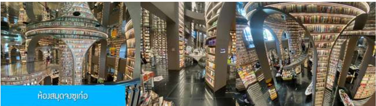
ห้องสมุดจซูก่อ