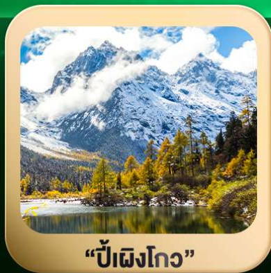
“ปี้ผิงโกว”

ชมธรรมชาติ 2 อุทยานขึ้นชื่อ อุทยานภูเขาสี่ครุณี + อุทยานปี้ผิงโกว สะพานหนานเฉียว • ถนนคนเดินไท่กู่หลี่ + ซุนซีลู่ + Pop Mart • ตงเจียวจื่อ