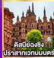
คิสบียังฉิง ปราสาทเวทมนตร์