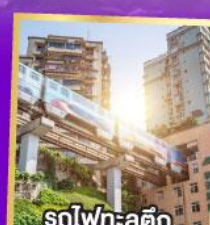
รถไฟฟ้า: ลูติก