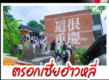
ตรอกซี้ยฮ่าวหลี่