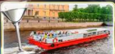
ล่องเรือแม่น้ำวอวา พร้อมเสิร์ฟ Vodka Tasting

📅 เดินทาง : 14-21 มิ.ย.69 / 28 มิ.ย.-05 ก.ค.69 / 24-31 ก.ค.69