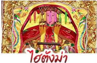
ไฮตั้งมา

มรดกโลกบ้านดินถู่โหลวเทียนโหลวเค็ง - สะพานเซียงจื่อ ไฮตั้งมา (เจ้าแม่กบกับทิม) - เอียงบูชิว (เจ้าพ่อเสือ) พระเจ้าตากสินมหาราช - อวนน้ำแร่จากธรรมชาติ ไม่ลงร้านช้อปปิ้ง - พักโรงแรม 4 ดาว เมนูพิเศษ!!! อาหารแต้จิ๋ว 18 อย่าง, ลู๊ทซ์ฟู้ด ห่านพะไลต้นตำรับแต้จิ๋ว