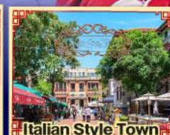
Italian Style Town