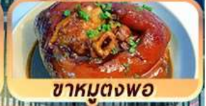
ชาหมูตงพอ