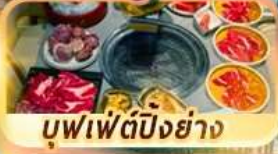
บุฟเฟ่ต์ปักกิ่งย่าง