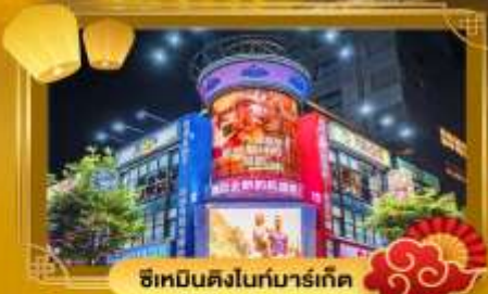
ช้อปปิ้งไนท์มาร์เก็ต