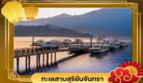
ทะเลสาบสุริยอินจันตรา